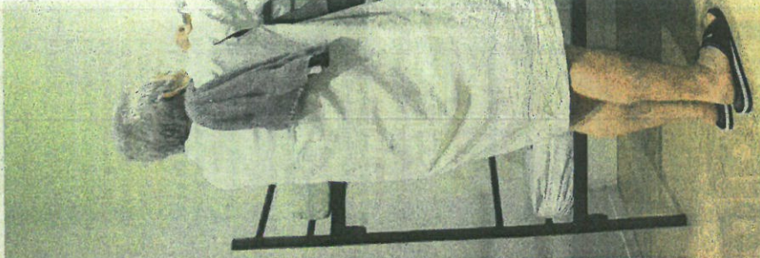
▲ Een Haagse dakloze maakt zich op voor de nacht bij de Kessler Stichting.

me. Volwassenen die in paniek aankloppen, omdat ze nergens heen kunnen, jongens van pakweg 21, 22 jaar die onder aan de wachtlijst komen en maar moeten zien waar ze de nacht doorbrengen. Of meisjes van 18 of 19 die wel een plaats krijgen, maar dan in de volwassenaanopvang tussen mannen met verslavingen en psychische problemen.