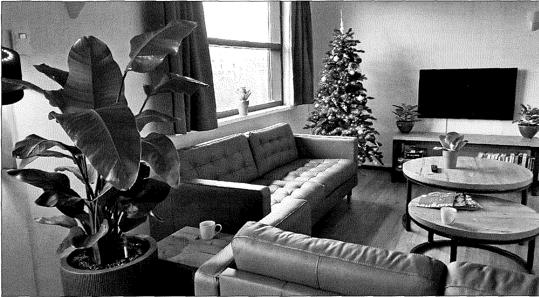
Na herinrichting en verbouwing zijn in het pand comfortabele verblijfsruimtes gecreëerd, zoals hier een deel van een huiskamer.