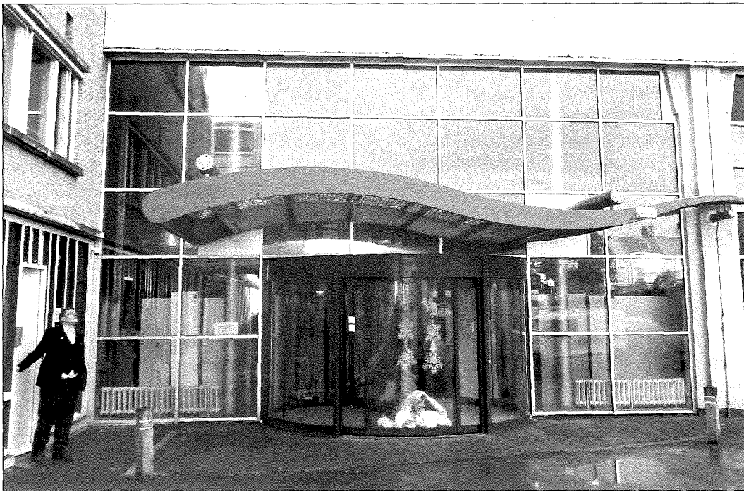
Bij de vroegere hoofdingang van het JKZ duidt niets erop dat hier tegenwoordig een opvangcentrum voor daklozen is gevestigd)

in de v de Vog stilletje volgen tot rus Het wa niet ee motive Ze noe omgev dat de ze me konde uitgin zoude voeler Shand liet de voord ze tot en wa mens bren hen a krijge